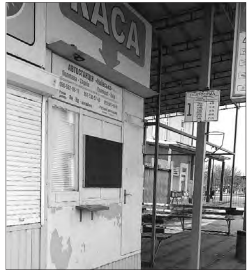
Гучно відкрита десять років тому в Полтаві автостанція «Київська» вже не діє.