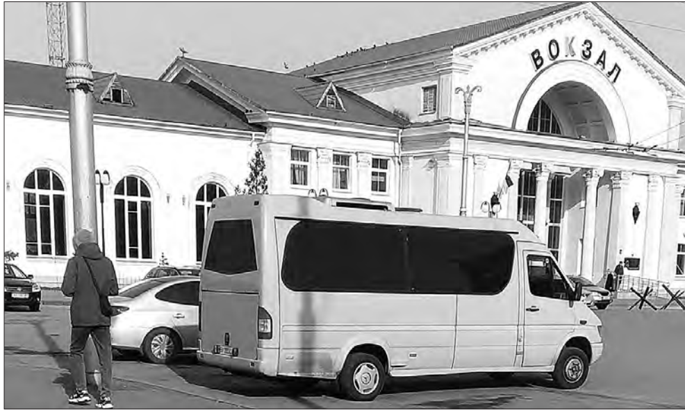
На площі біля залізничного Київського вокзалу обласного центру запрошують у бусики до столиці тепер тільки поодинокі тінювики.

Полтавець Микола Шупик на ринку пасажирських перевезень працює вже понад тридцять років. Тепер це його сімейний бізнес, до якого долучив близьких родичів. Має три десятки автобусів різної місткості, якими закриває понад два десятки приміських і міжміських маршрутів. Суто міський, полтавський, у нього