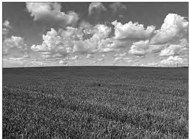
Озимина у доброму стані.

гривень за тону. За останні два тижні ціна піднялася до 5000 гривень, що покриває затрати на вирощування. Звісно, брак коштів не