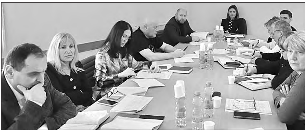
Проблеми професійної освіти та діяльність навчальних закладів в умовах війни обговорили на комісії Хмельницької обласної ради.

Цьогоріч перший урожай зібрали вже на початку березня. Майбутні працівники тепличного господарства вчать вирощувати огірки, помідори, перці, інші культури. Водночас навчальний заклад може добувати певні доходи від прода-