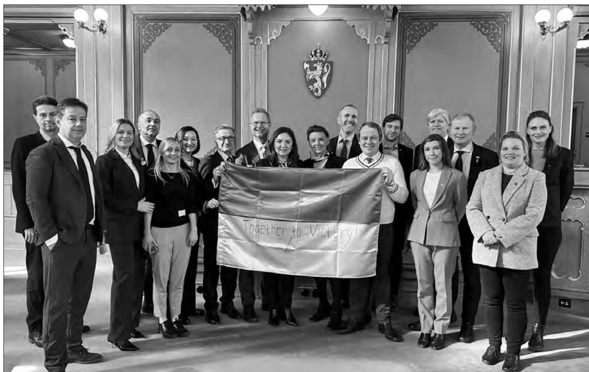
Під час зустрічей народних депутатів України з парламентаріями Норвезького Стортингу.

«Як член постійної делегації України в ПАРЄ, повідомила про те, що Асамблея ухвалила резолюцію щодо «підтримки Перемоги України» і визнання